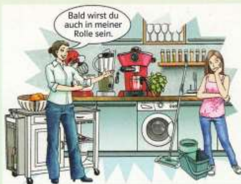
4 Ein besonderes Geschenk

4 Abb. 4 thematisiert die Hausarbeit . Überlege dir zu dem Inhalt der Zeichnung eine Geschichte.